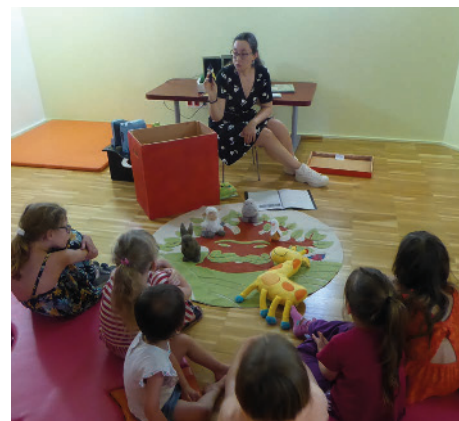
Animation Tapis animo