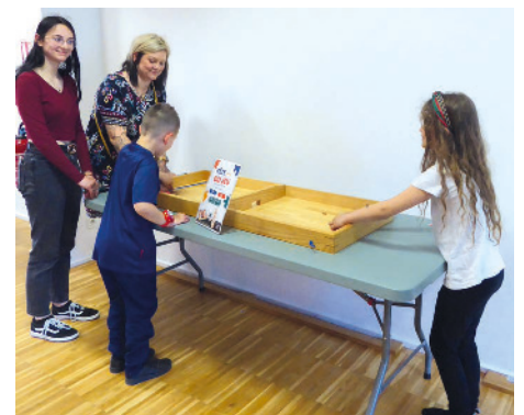
Fête mondiale du jeu