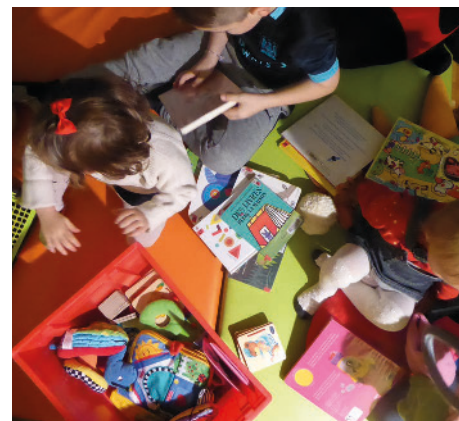
Nuit de la lecture 2023