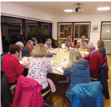
Mille feuilles gourmandes

lorrain comme on le cause", un ouvrage présenté avec beaucoup de verve et d'humour qui doit permettre aux Lorrains de renouer avec leurs différents parlers pour mieux les revendiquer et les transmettre. En avril 2023, Victor Noël, auteur et jeune naturaliste mosellan, est venu éveiller les consciences à l'égard du vivant avec son livre "Sur les chemins du vivant - Carnet de bord d'un jeune naturaliste engagé". À chaque rencontre, les lecteurs répondent nombreux à ces échanges.