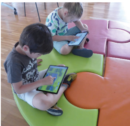
La petite fabrique à histoire