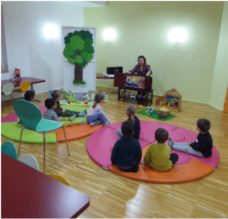
Accueil de classe