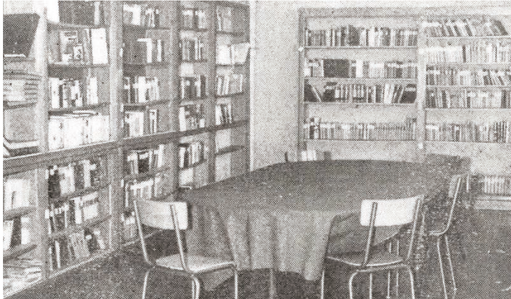
La bibliothèque en 1965

Le pôle culturel Médiathèque-Théâtre a ouvert ses portes à l'automne 2013. Cette réalisation, beaucoup de villes de la taille de Jarny nous l'envient. Il a fallu, pour faire aboutir ce projet, une volonté politique ambitieuse et vaincre bien des réticences. Cependant, aujourd'hui, cette double réalisation fait la fierté des Jarnysiens, tant elle contribue à animer la vie culturelle du Jarnisy. La Maison d'Elsa est devenue un lieu emblématique de la culture à Jarny, accueillant et chaleureux.