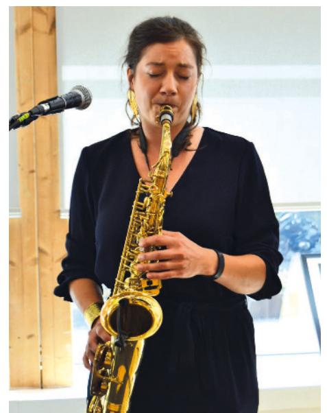
Veilleuse en concert