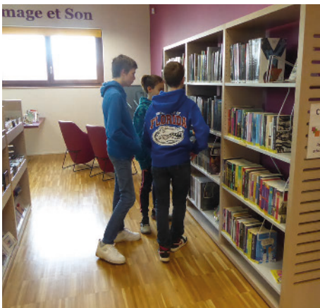
École ouverte collégiens