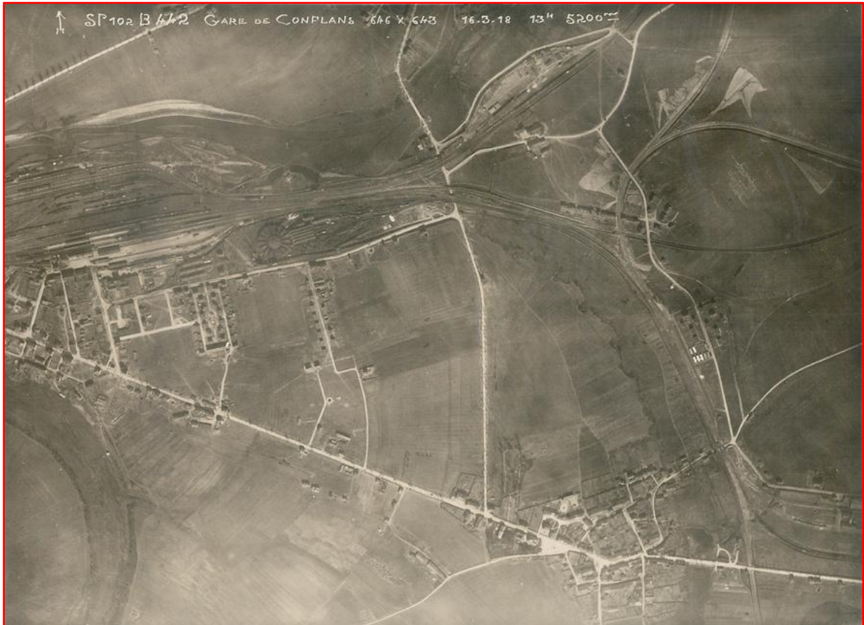
Photographie aérienne de la commune de Jarny, réalisée par l'aviation militaire française le 16/03/1918 à l'altitude de 5200 mètres.