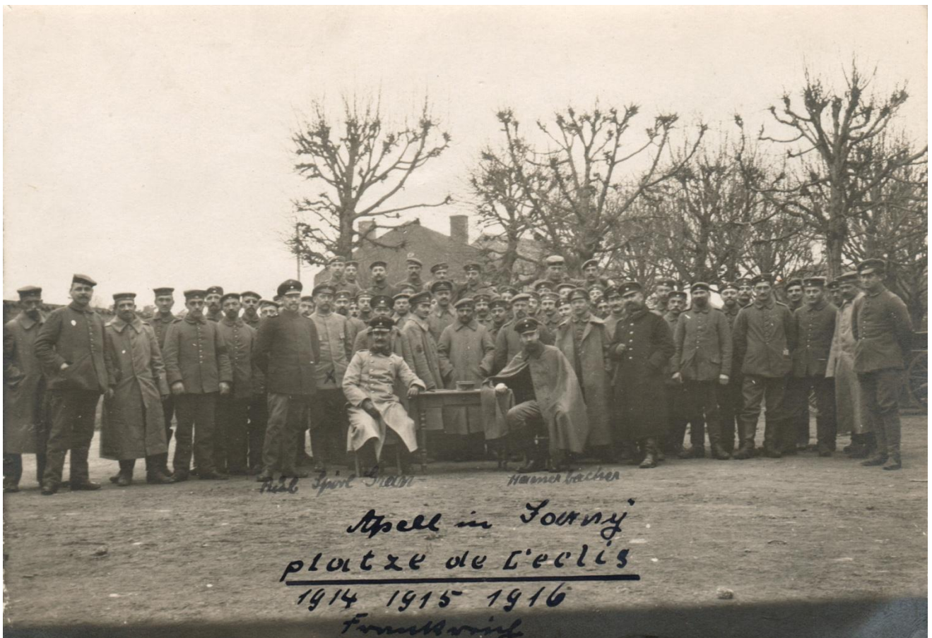
Officiers et soldats allemands posant pour l'appel sur la place de l'église St-Maximin à Jarny; cliché de 1916.