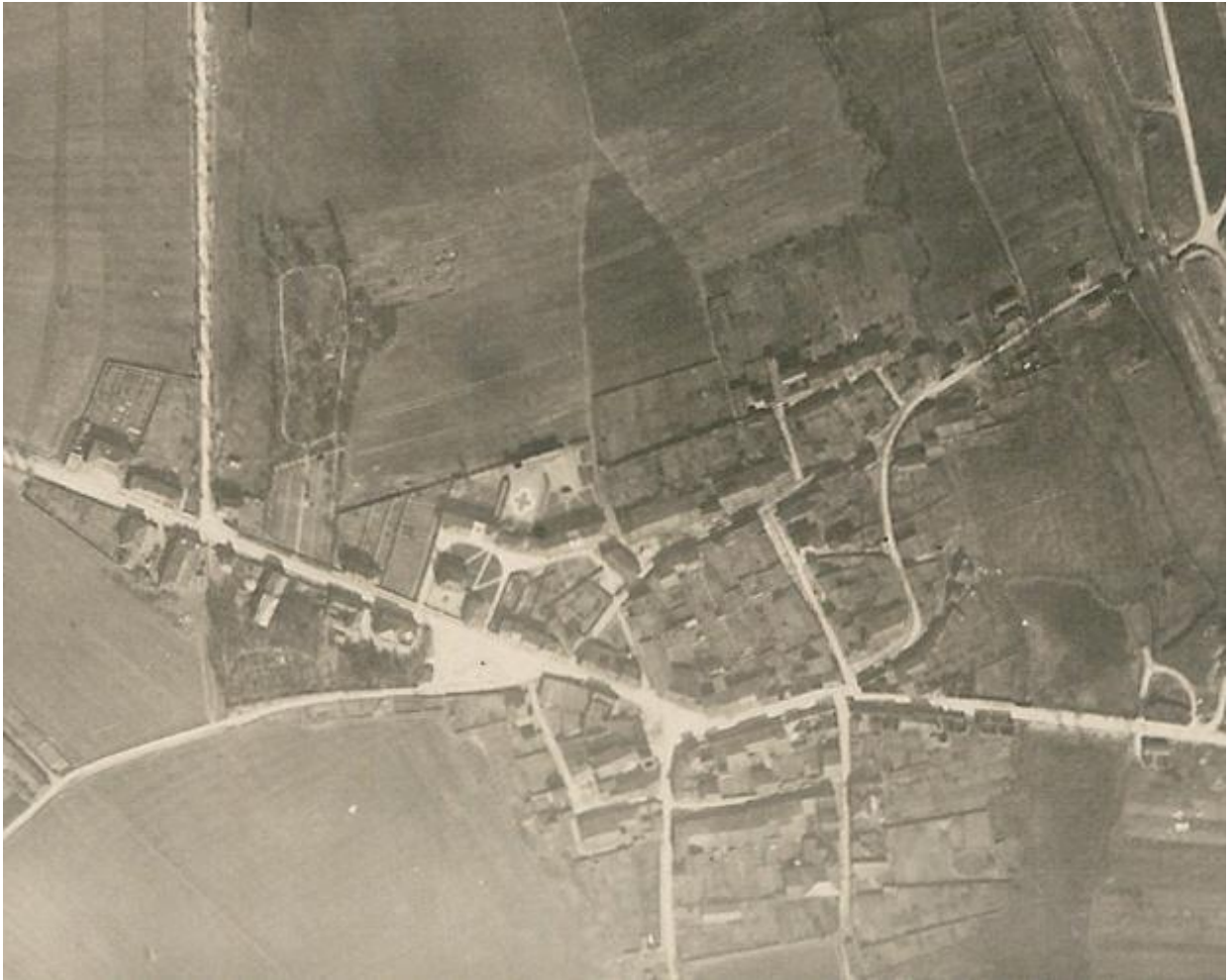
Zoom sur le quartier Jarny-centre.