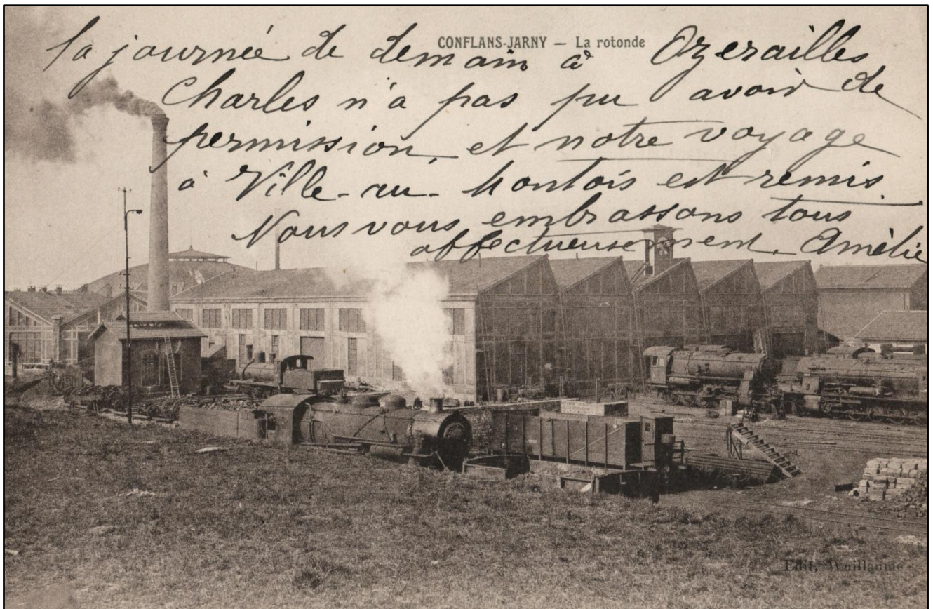
Les ateliers d'entretien de la Compagnie de l'Est en gare de Conflans, avec sur la gauche, le sommet de la rotonde.