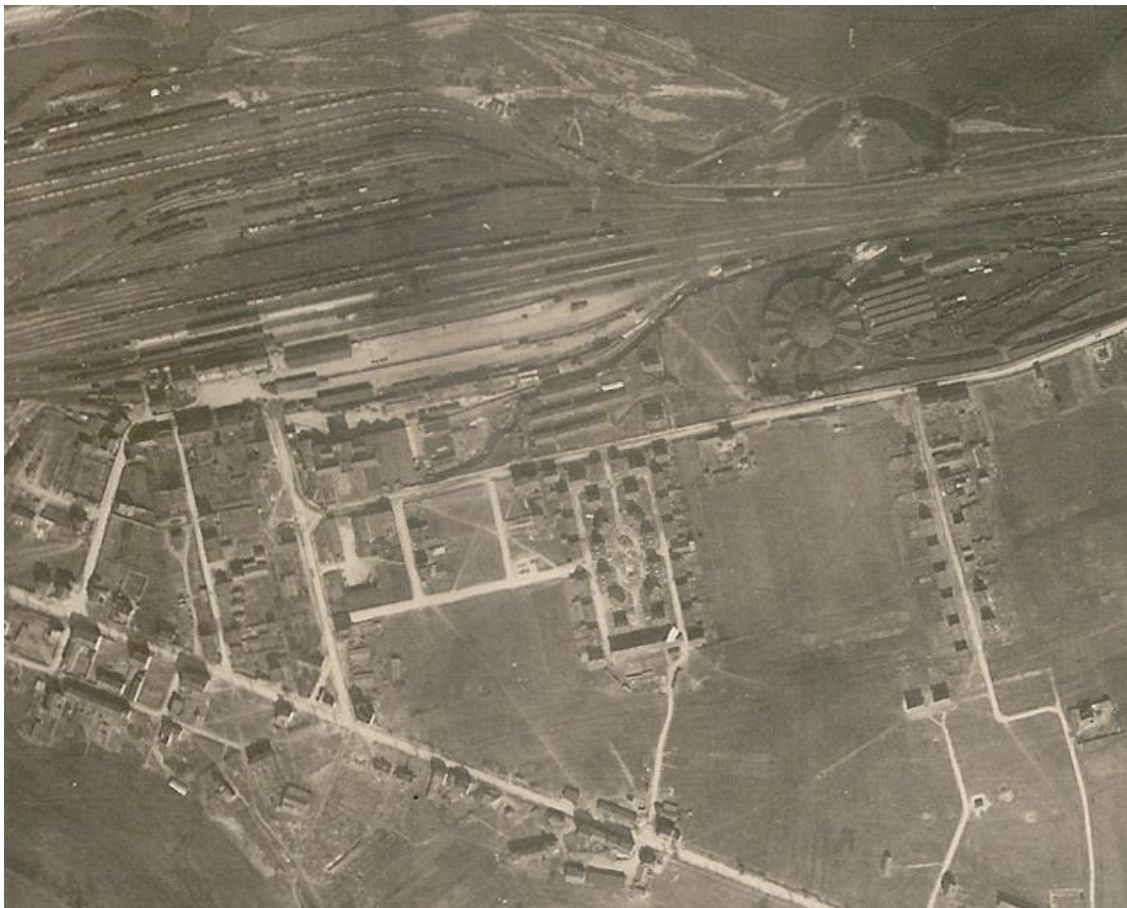
Zoom sur le quartier Jarny-Gare.