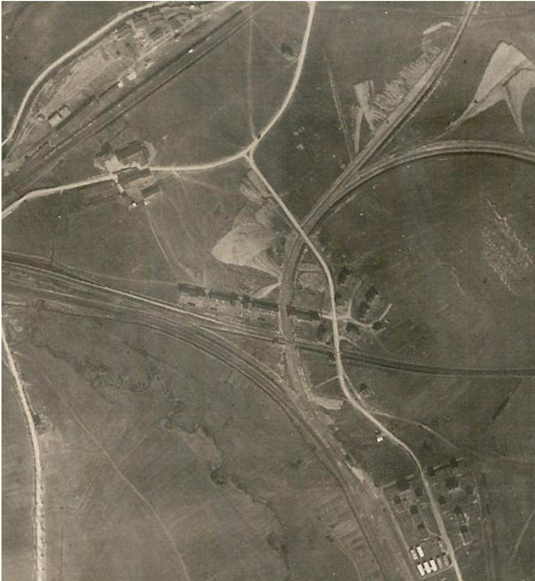
Zoom sur le quartier de Moulinelle.