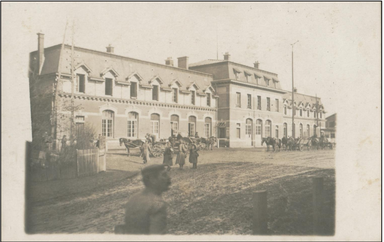
Militaires allemands sur la place de la Gare en janvier 1918.