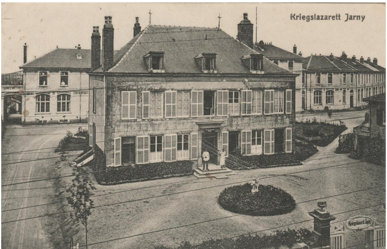
La mairie de Jarny et le groupe scolaire Alfred Mézières vers 1916; les bâtiments sont transformés en Kriegslazarett par l'occupant.